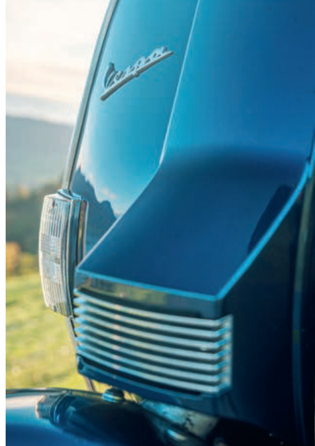
Zeitlos, klassisch, makellos: Das Design der Vespa 125 PX ist der stilistische Gradmesser geblieben.

Schon früh weitete Piaggio seine Produktpalette aus. 1948 folgten der auf der Vespa-Plattform aufgebaute, dreirädrige Kastenwagen Ape (zu Deutsch «Biene») und das erste Modell mit 125 Kubikzentimetern, die Vespa 125. Über die Jahre wurden zahlreiche neue Modelle entwickelt, technische Neuerungen wie die Stossdämpfer implementiert und von jedem Modell mehrere Hubraumvarianten (in der Regel 50, 125 und 150 Kubikzentimeter) angeboten, um so neue Märkte zu erschliessen. 1977 kam die Vespa 125 PX auf den Markt, die sich über knapp 40 Jahre zu einer der beliebtesten Vespas entwickeln sollte. Das etwas hakelige, handgeschaltete Viergang-Getriebe, das charakteristische Knattern des Zweitaktmotors, der nie ganz dichte Vergaser und die typische Formensprache fanden Fans auf der ganzen Welt, die bittere Tränen weinten, als mit der Einführung der Euro-4-Abgasnorm 2017 die Einstellung der PX-Produktion bekannt gegeben wurde.